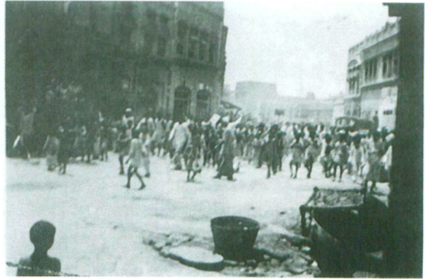
احمدیہ بیت الفضل فیصل آباد فسادات ۱۹۵۳ء کے دوران میں